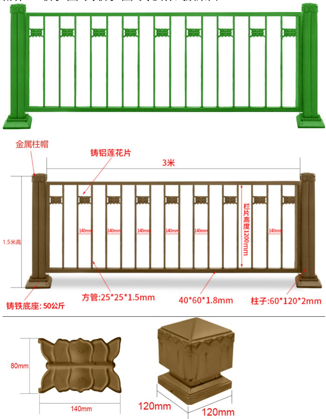
附件 1：防护栏尺寸防护栏尺寸及样式效果图