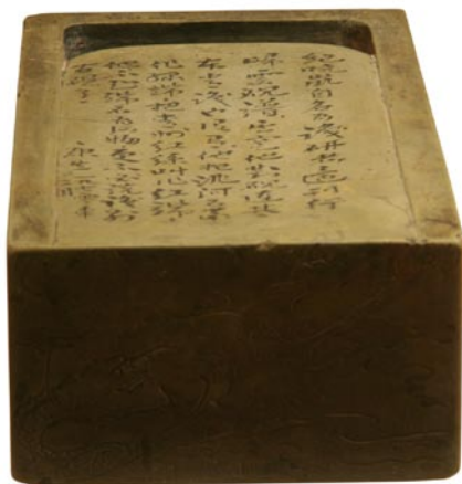
洮 (táo) 河石 长方砚

洮河石产于甘肃古洮州，因石在临洮大河深水之底，非人力所能致，得之即为无价之宝。洮河砚以其石质细密、光滑清丽、纹理如丝而出名，唐宋时曾作为贡品进奉朝廷。