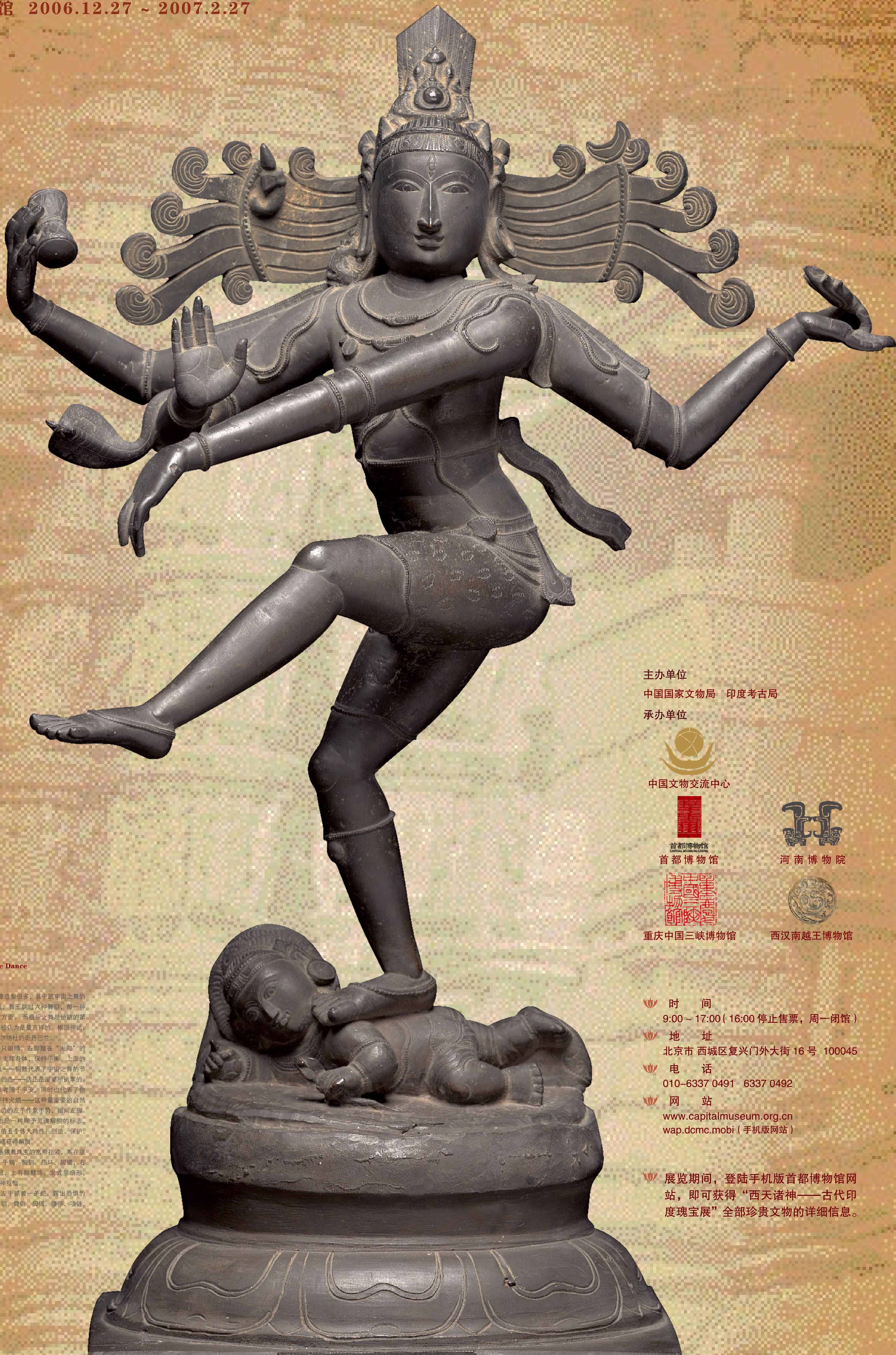
舞王湿婆像 Siva as Lord of the Dance 公元18世纪 68 × 42 × 26 厘米

舞王湿婆的石像和青铜像造型很多，其中就宇宙之舞的舞王像无疑是最精彩的。据说，舞王跳过六种舞蹈，每一种舞蹈表现他的存在的一个特定方面。而极乐之舞是他跳的第七种舞蹈，综合了上述六种，被认为是最吉祥的。根据神话，湿婆首次跳这个舞蹈是在泰米尔纳杜的奇丹巴兰。